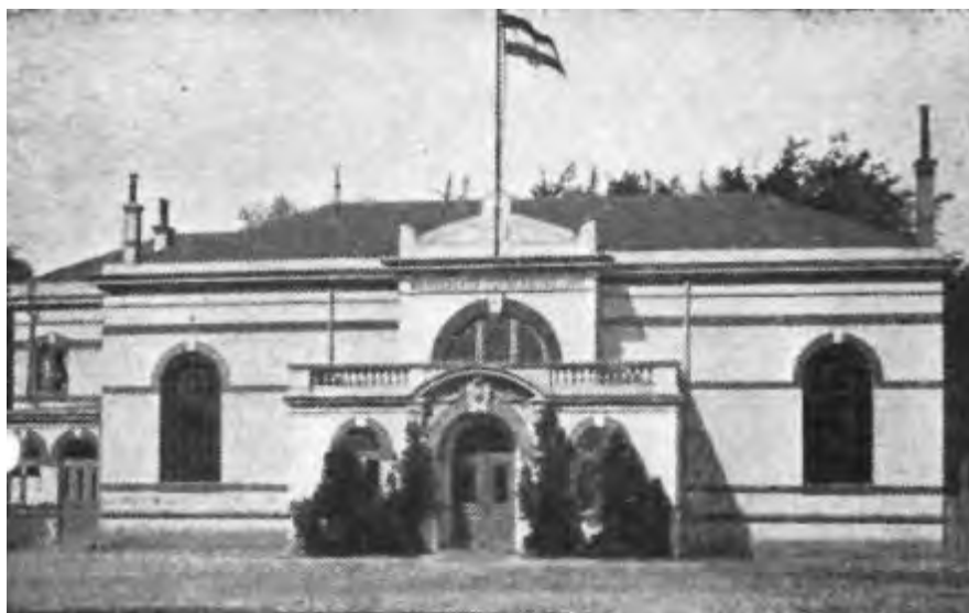
Die alte Turnhalle des Wandsbeker Turnerbundes.

Eigentlich, so schreiben die WTB-Vertreter unter Federführung ihres Vorsitzenden Eichhorn, habe der Verein eine eigene Turnhalle auf dem Marktplatz bauen wollen. Dafür hatte er das Fleckens-Collegium um Erlaubnis und um die Zuweisung eines Bauplatzes gebeten. Das Collegium war, so in einem Schreiben vom 28. Januar 1867, nicht abgeneigt und hatte das Projekt der nächst höheren Behörde zur Berücksichtigung empfohlen. Diese, die königliche Regierung für Holstein, beschied ebenfalls positiv – doch zu welchen Bedingungen! Der Verein musste vor Beginn der Ausführung einen Bauriss und einen Lageplan einreichen,