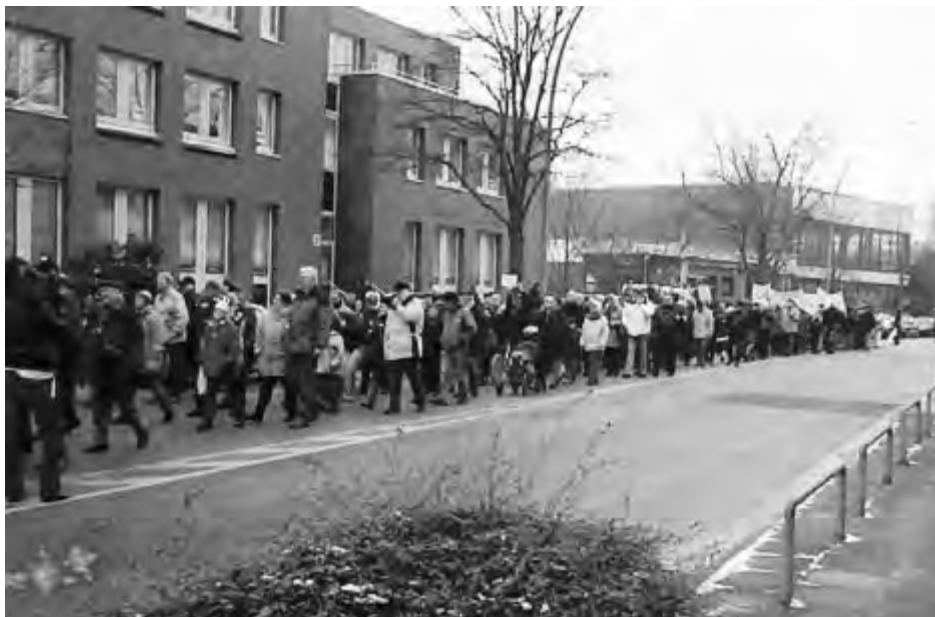
Beginn der großen Demonstration rund um den Wandsbeker Marktplatz am 30. Januar 2005.

Sofort begannen wir mit einer Unterschriftensammlung, die von der ersten Stunde an außerordentlich erfolgreich war und von mehreren Kundgebungen begleitet wurde. Am 26. Januar 2005 gab es auf dem Hamburger Rathausmarkt die Demonstration des Hamburger Schwimmverbandes, bei der auch ich vor den annähernd 2.000 Teilnehmern die