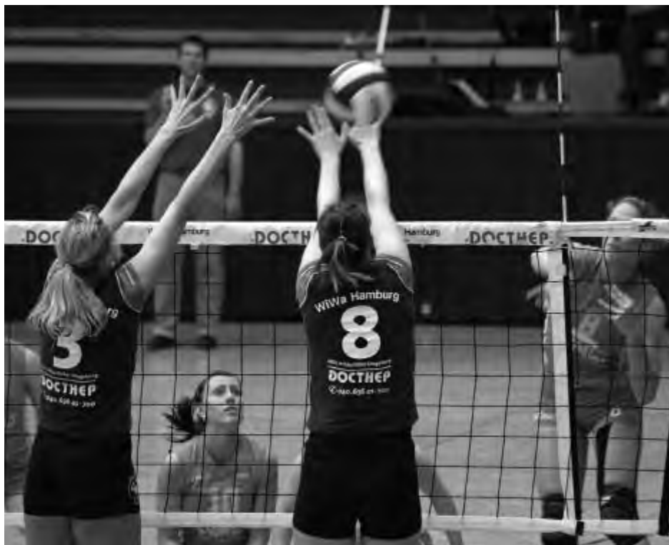
Spieldzene WiWa Hamburg gegen USC Münster am 8. April 2007.

Im März 2009 kündigte die HT16 völlig überraschend und nicht unbedingt auf sportlich-faire Weise seine Mitgliedschaft in der Spielgemeinschaft VG WiWa. Mit diesem einseitigen Schritt und einer extrem negativ verlaufenen Trennungsphase verlor die Spielgemeinschaft einen bis dahin wichtigen Partner. Das sehr erfolgreiche Modell einer Spielgemeinschaft aus drei Vereinen mit einem großen Einzugsgebiet zwischen Hamm und Wandsbek wird nun mit den verbleibenden Vereinen WTB und SSV Wicherschule fortgesetzt.