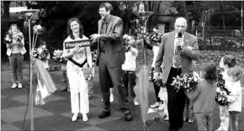
Einweihung des Finnja-Platzes am 8. April 2009.

Der WTB nutzt, wie die meisten Hamburger Sportvereine, für die Durchführung seines Übungsangebotes die bisher noch kostenfrei zur Verfügung gestellten Schulturnhallen. In der Regel kann hierin der Vereinssportbetrieb erst ab 17 Uhr, in Ausnahmen auch bereits ab 15 Uhr beginnen. Der WTB nutzt seit Jahren die Hallen Kneesestr. (100 Prozent), Schimmelmannstraße (50), Friedastraße (75) und Holstenhofweg (25). Zusätzlich nutzte die Volleyballabteilung weitere Hallen. Die Halle Friedastraße war bis zu den 80er Jahren in eine Sonderschule integriert und stand nach deren Schließung separat weiterhin zur Verfügung. Anfang 2000 überlegte die Schulbehörde die Schließung der Halle Friedastraße.