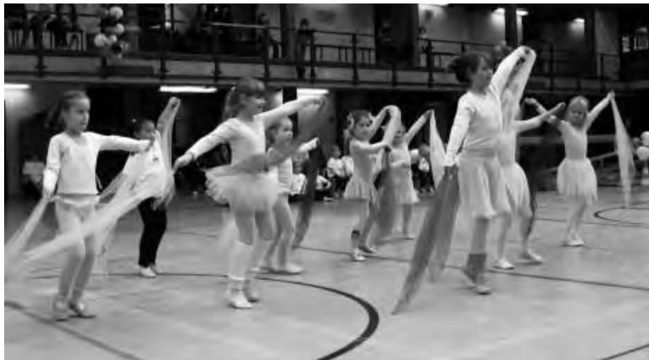
Ballettgruppe beim Kinderturnsonntag 2008 in der Wandsbeker Sporthalle.

Auf der Messe „Du und Deine Welt“ haben die Kinder mit Ihrer Cheerleader-Vorführung viel Beifall errungen. Die Höchstleistungssportshow in Alsterdorf wurde von den Hamburger Turnkindern mit dem „Turntiger-Tanz“ vervollständigt. Zu den Veranstaltungen gehört ebenfalls der jährliche Kinderturn-Sonntag im November und auch die Abnahme des Kinder-