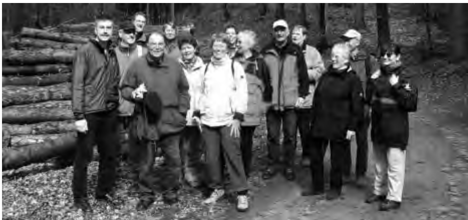
Wandergruppe auf dem Weg nach Lauenburg am 30. April 2006.

Der beliebteste Treff ist jedoch die Winter-