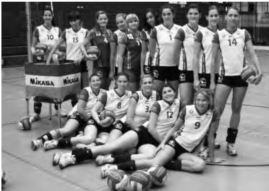
Unsere Bundesliga-Mannschaft 2006.

Die größte WiWa-Leistung war 2006 der Aufstieg der 1. Damenmannschaft in die Volleyball-Bundesliga. Was für ein Jahr: spannend und erfahrungsreich. Mit umjubelten Siegen, mit herben Niederlagen. Es war alles dabei. Schade: Die WiWa-Spielerinnen mussten die Bundesliga noch im selben Jahr wieder verlassen. Als reine Amateurm Mannschaft und ohne ausreichendes finanzielles Polster durch Sponsoren war es unmöglich, in der höchsten deutschen Spielklasse zu bestehen. Dennoch: Die WiWa-Mannschaft und damit auch der WTB waren stolz auf das Erreichte