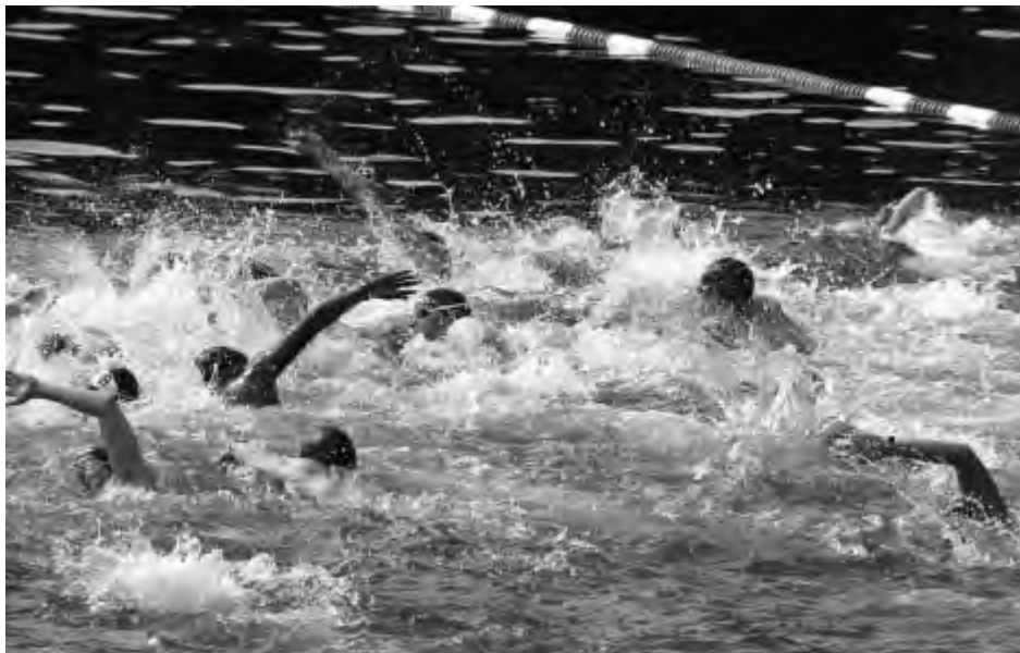
Unsere Teilnehmer beim Freiwasser-Wettbewerb der Masters-Schwimm-WM in Göteborg 2010.