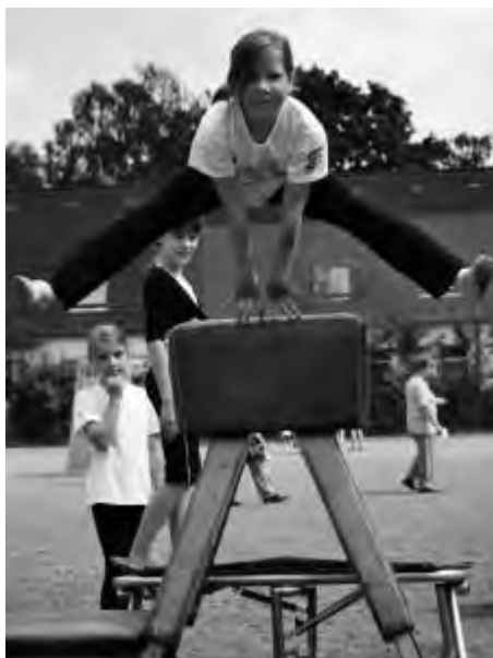
Show-Vorführung beim Kinder-Sommerfest 2010.

Genau so umfangreich ist die Palette im Bereich Kindertanz. Auch hier haben Eltern mit ihren Kindern im Alter von eineinhalb bis drei