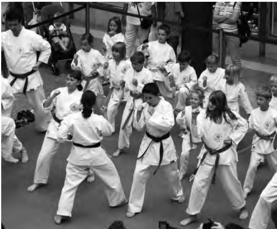
2009 – Karate-Vorführung im Rahmen von „Sport vor Ort“ im Wandsbek QUARREE.

Auf Seminaren werden weitere Stile dieses vielseitigen Sports vermittelt, zum Beispiel Kyokushin Budo Karate.