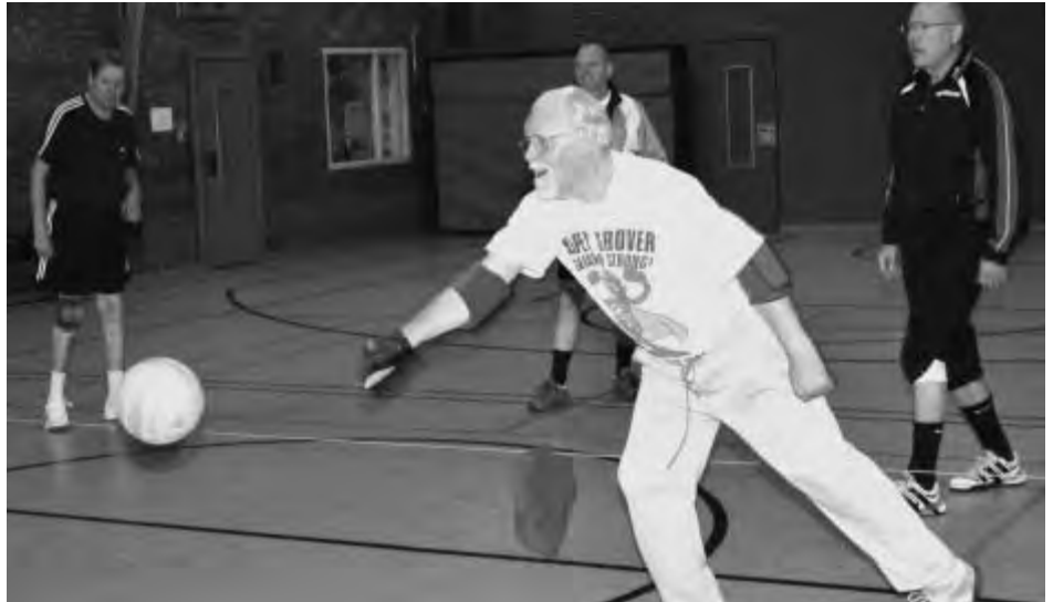
Prellball-Training in der Sporthalle Schimmelmannstraße.