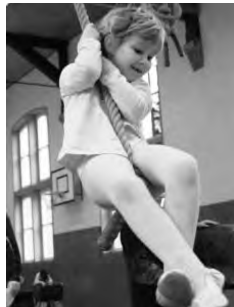
Früh übt sich – Kinderturnsonntag 2009.

Jahren die Möglichkeit zum gemeinsamen Tanzen unterstützt von interessanten Singspielen.