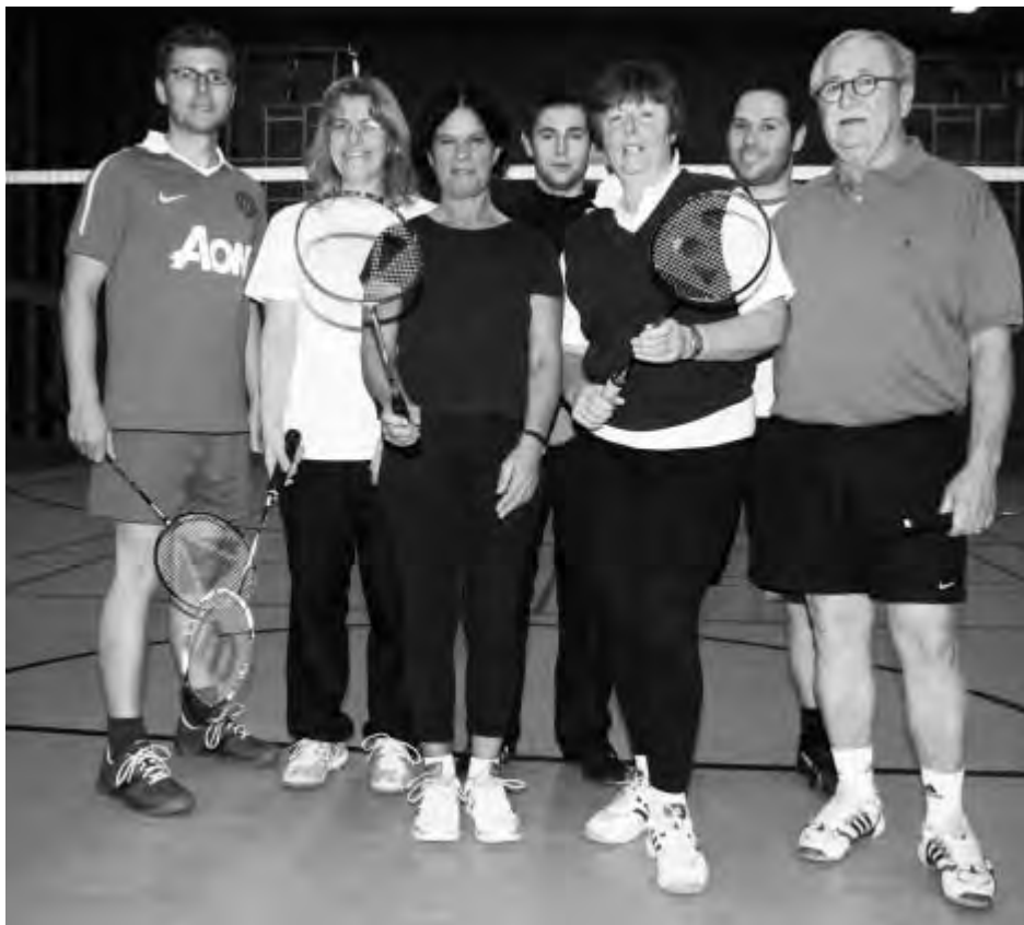
Die WTB-Hobby-Badminton-Gruppe-25-65 Jahre ist mit Spielfreude dabei.

Hochaktuell und spannend ist derzeit die Findung einer Sporthalle mit mindestens zwei Spielfeldern, die erkennbare Badmintonlinien haben, um einen Trainingsbetrieb mit acht Spielern/innen zu gewährleisten und auch neue Mitspieler zu werben.