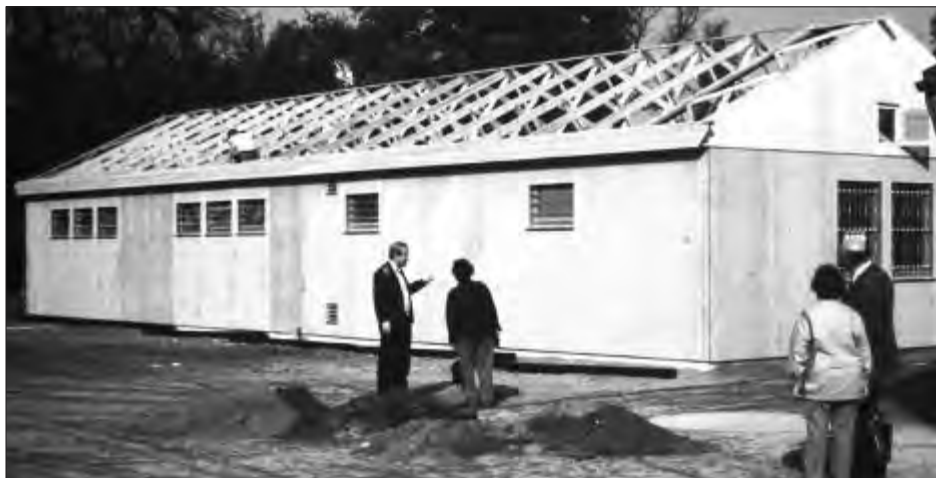
1986 – das Vereinsheim wird verwirklicht.

Es gibt in Hamburg nur wenige Großsportvereine, die zumeist aufgrund ihrer wirtschaftlichen Situation über vereinseigene Sportanlagen verfügen und dadurch unabhängiger ihren Sportbetrieb durchführen können. Dagegen muss man aber sehen, dass Eigentum natürlich teilweise nicht unerhebliche Kosten beim Unterhalt bzw. notwendige Reparaturen verursacht.