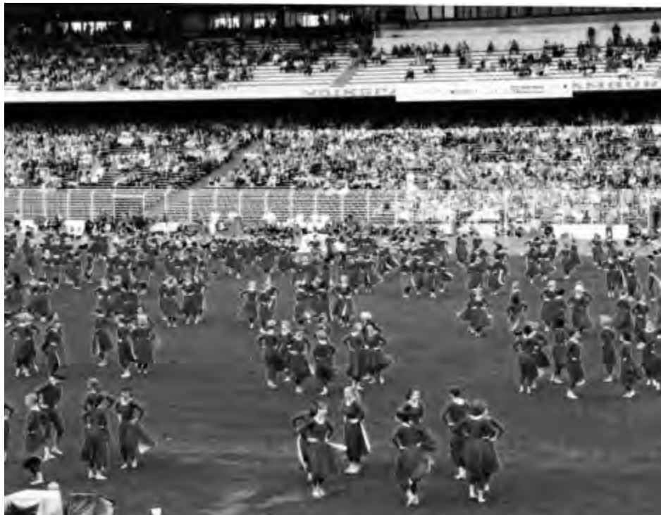
Deutsches Turnfest 1994 in Hamburg, unsere Großgruppe im Volksparkstadion.

Unsere weiteste Reise führte uns dann 2003