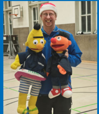
Tischtennis-Mini-Turnier, Badminton auf der Straße aktiv und Zuwachs in der TT-Abteilung des WTB