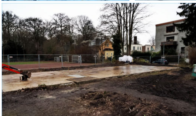
Hier stand mal unser WTB-Vereinshaus ...